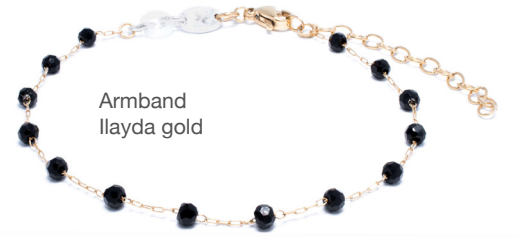
Armband llyda gold