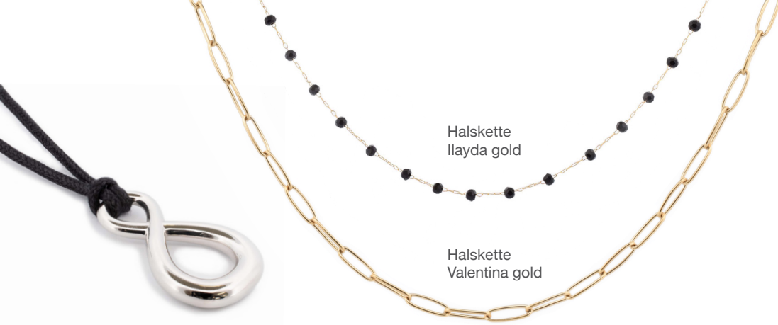
Halskette llyda gold